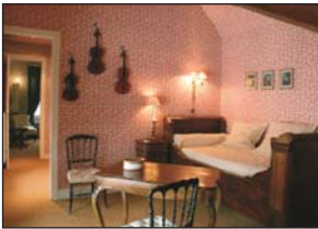
La suite musicale