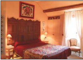
La chambre orientale