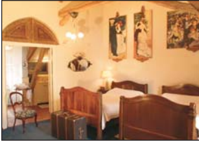
La chambre du photographe