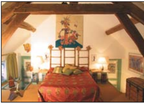
La chambre du voyageur